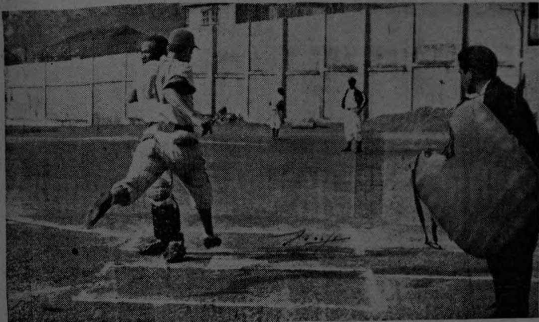
Ayer se reanudó el campeonato mayor capitalino de beisbol jugándose dos partidos en el Parque Antonio Escarré. Esta escena corresponde al primer juego en el que los peloteros del Hopec después de estar perdiendo ante Gigantes reaccionaron para ganar espectacularmente. Aquí vemos una de las tres carreras que anotaron los gigantes para ceder terren después.